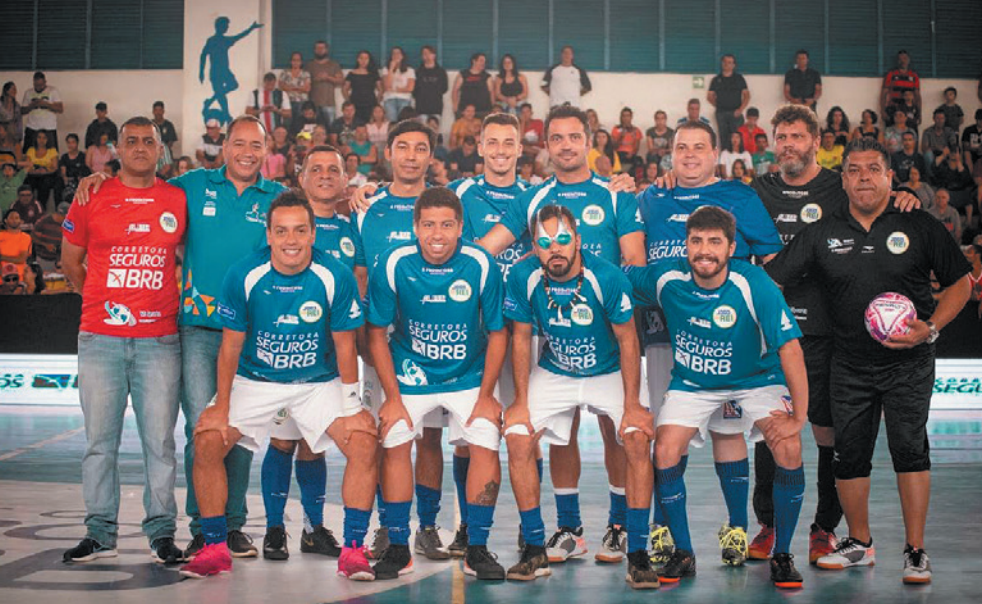
Time escalado para o Jogo do Rei

Por meio de uma parceria entre a Alfa Seguradora, a Corretora de Seguros BRB, a American Life e os organizadores do evento, as empresas A Produtora e V2 Sport, foi possível a realização do Jogo do Rei, que ficou conhecido como “Mais do que um jogo, um espetáculo em quadra”, e permitiu que sua apresentação fosse reconfigurada, tornando-se padrão para as próximas edições.